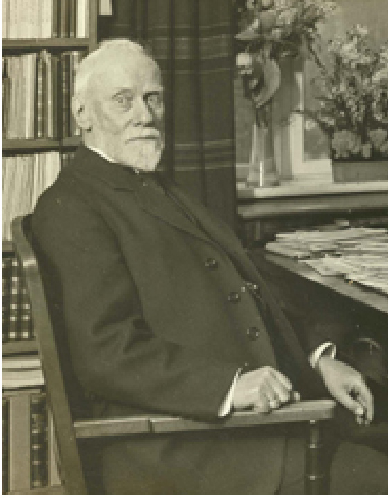
Orhun alfabesini çözen Danimarkalı dilbilimci Vilhelm Thomsen.

Edward Harper Parker tarafından yapılmış İngilizce bir çevirisini de [14] içermektedir. [15] Thomsen'in bu başarılı yayını kendisinden sonra Orhun Yazıtları üzerine çalışan bilginler tarafından da örnek alınmıştır.