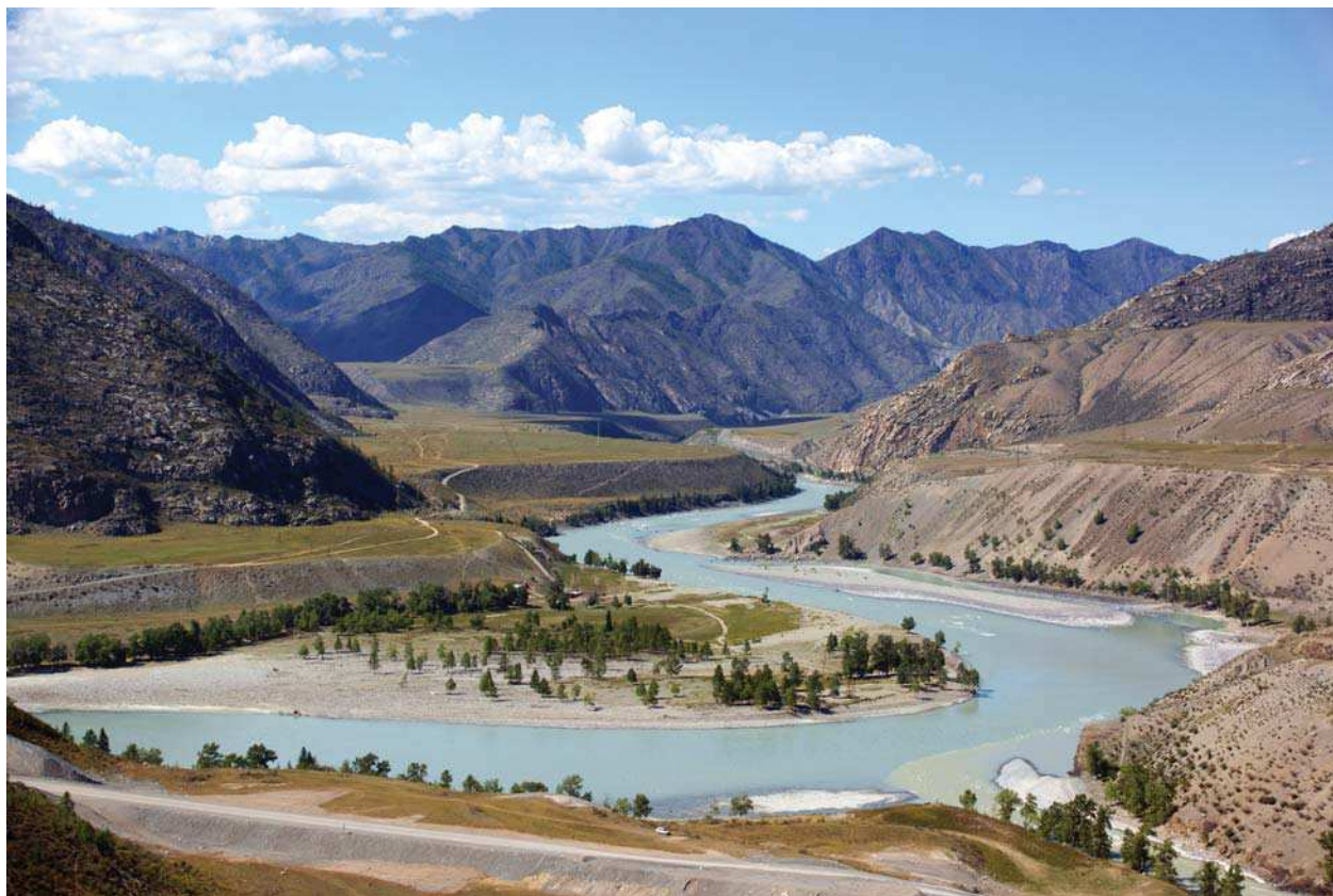
Рис. 5. Вид на слияние Чуи и Катунь и бом Бичикту-Кая.

Устье Чуи и место ее слияния с Катунью в этнографическое время также были границей между племенами алтайцев: теленгитами, живущими в долинах Чуи и Аргута, и алтай-кижи в Центральном и Северном Алтае. Так не эту ли природную границу, дополнительно укрепленную людьми, и дальнейшее продвижение в Центральный Алтай имел в виду в своем метафорическом выражении автор калбак-ташской надписи, обращаясь к своим соплеменникам?