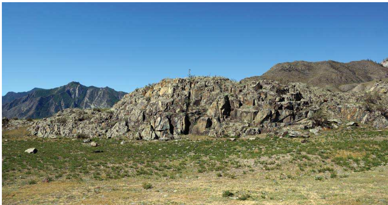
Рис. 2. Общий вид на горную гряду в местности Чуй-Оозы, где обнаружена руническая надпись.