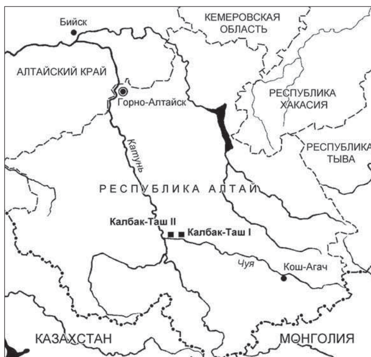
Рис. 1. Место расположения петроглифического пункта Калбак-Таш II.

Руническая надпись была зафиксирована на скальном останце, протянувшемся каменной грядой поперек долины р. Чуи, к северу от полотна Чуйского тракта, в местности Чуй-Оозы (рис. 2). Каменная гряда образует большие скальные уступы почти правильной прямоугольной формы. На одном из них на вертикальной поверхности, обращенной на восток, четко вырезана короткая руническая надпись (рис. 3). Сланцевая скальная поверхность в этом месте поросла мхом и лишайником. Последние знаки, в нижней части надписи, налегают на более раннее выбитое изображение животного.