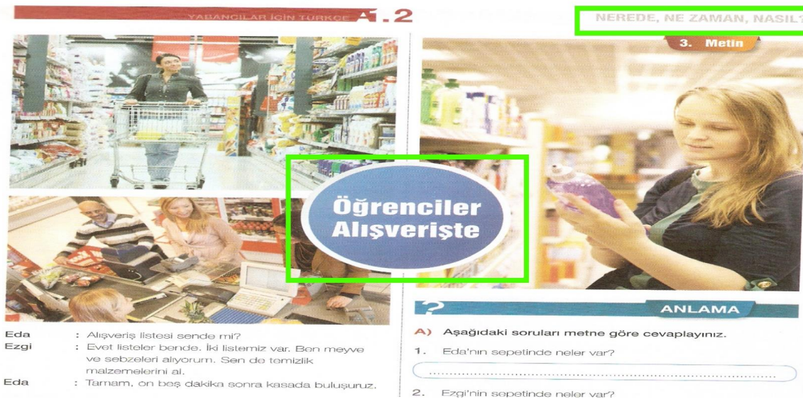
Fotoğraf 2: Gazi Üniversitesi TÖMER Yabancılar İçin Türkçe Öğretim Seti A1-A2 Kitabı

A1-A2 ders kitapları hazırlanırken konuların seçiminde ve sıralanışında iletişim odaklı ve çeşitli kavramları öne çıkaran bir yaklaşım benimsenmiştir. Kitapta yer alan her metin anlama, yazma, konuşma, dil bilgisi bölümlerine ait etkinliklerle desteklenmiştir. İçerik olarak konular bireyin yakınından uzağına ilerleyecek şekilde sıralanmıştır. Temalar oluşturulurken Türkçenin konuların gündelik yaşamda gerekliliği ve birbirleriyle olan ilişkileri göz önünde bulundurulmuştur. Böylece öğrencilerin; birbiriyle ilişkili sözcük ve kavramları bir arada öğrenirken, gündelik hayatta kendilerine en gerekli olan sözcük ve kalıpları öncelikli olarak öğrenmeleri amaçlanmıştır (Fotoğraf 2). Sonuç olarak, Gazi Üniversitesi TÖMER Yabancılar İçin Türkçe Öğretim Seti A1-A2 Kitabı kavramsal-işlevsel bir izlenceye uygun hazırlanmıştır.