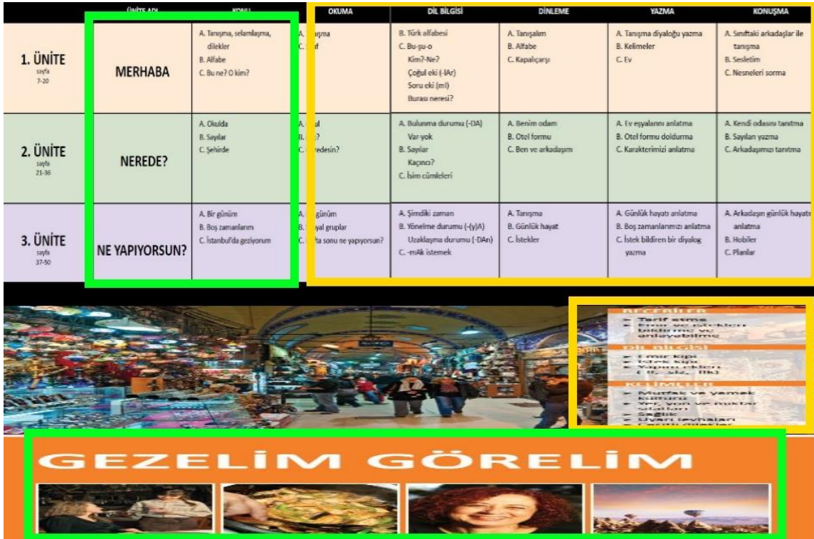
Fotoğraf 3: İstanbul Yabancılar İçin Türkçe Öğretim Seti A1-A2 Kitabı

Fotoğraf 3'e bakıldığında, yeşil renkle çerçevelenmiş ünite başlıkları gündelik yaşamda karşımıza çıkan kavramlardan ve işlevlerden oluşmaktadır. Bu yüzden İstanbul Yabancılar İçin Türkçe Öğretim Seti A1-A2 kitabının kavramsal-işlevsel bir izleneye sahip olduğu söylenebilir. Ayrıca sarı renkle çerçevelenmiş bölümde dilbilgisi konularının kolaydan zora gidecek şekilde sıralandığı ve dil becerileri üzerinden bir sınıflandırma yapıldığı görülmektedir. Bu yüzden yapısal ve beceriye dayalı izlencelerin de dikkate alındığı söylenebilir. Sonuç olarak İstanbul Yabancılar İçin Türkçe Öğretim Seti A1-A2 kitabı üç izleneye türünü (kavramsal-işlevsel, yapısal ve beceriye dayalı) benimsemektedir.