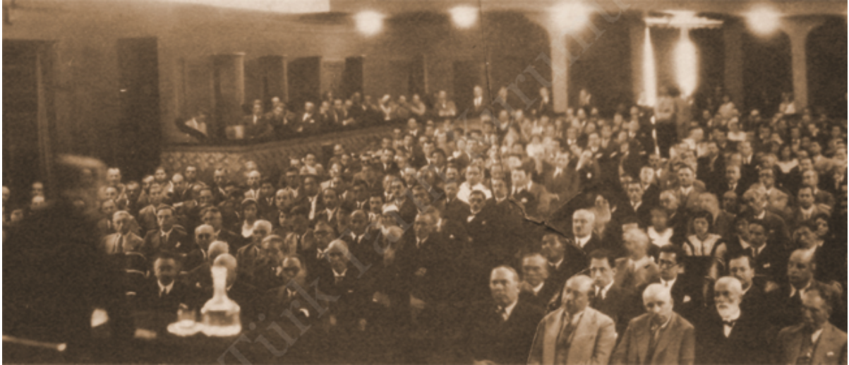
Resim 1: Ankara Halkevi'nde düzenlenen I. Türk Tarih Kongresi'nden bir kare (1932)

Türk tarihine muazzam katkılarda bulunmuş ünlü âlimlerimizden Prof. Dr. Zeki Velidi Togan , Türkiye'de olduğu kadar Avrupa 'daki şarkiyat ve Türkoloji cemiyetleri tarafından da saygı ile anılan ve eserlerine sıkça atıfta bulunulan değerli bir bilim insanı olarak tanınmaktadır. Çarlık dönemindeki Rusya 'da doğup büyümüş olup eğitim hayatı sonrası Kazan 'da tarih hocalığı yapar. Başkurdistan 'da siyasetçi kimliği ile devrim sürecinin de fiilen içinde bulunan Togan , Bolşevikler ile anlaşamayınca Türkistan 'a geçerek mücadelesini buradan sürdürmeye çalışır 1 . Ruslar'ın bu bölgede de etkin olmasıyla önce İran , sonrasında Afganistan 'a geçer ve bu ülkelerde ilmî araştırmalarda 2 bulduktan sonra bir süre Avrupa 'da yaşayıp Maarif vekili Hamdullah Suphi 'nin davetine icabet ederek 1925 senesinde Türkiye 'ye gelir. Akabinde Ankara 'daki Maarif Vekâleti Telif ve Tercüme Cemiyeti ile İstanbul 'daki Darülfünûn Edebiyat Fakültesi gibi kurumlarda görev alır 3 . 1930lu yılların başında "Türk Tarih Tezi" başlığı altında yapılan çalışmalara eleştiriler yöneltir ve bu eleştirilerini 1932 senesinde düzenlenen I. Türk Tarih Kongresi 'nde de dile getirir. Togan 'ın 7 senelik Türkiye 'den kopuş hikâyesi işte bu kongredeki hararetili tartışmalar ile başlayacaktır.