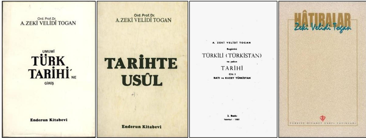
Resim 4: Zeki Velidi Togan'ın neşrettiği kitaplardan örnekler