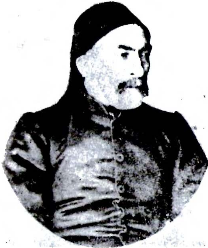
Res. 7 — Kibrılı Mehmet Emin Paşa