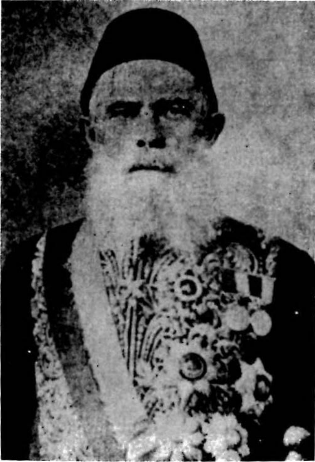
Res. 9 — Ahmet Cevdet Paşa