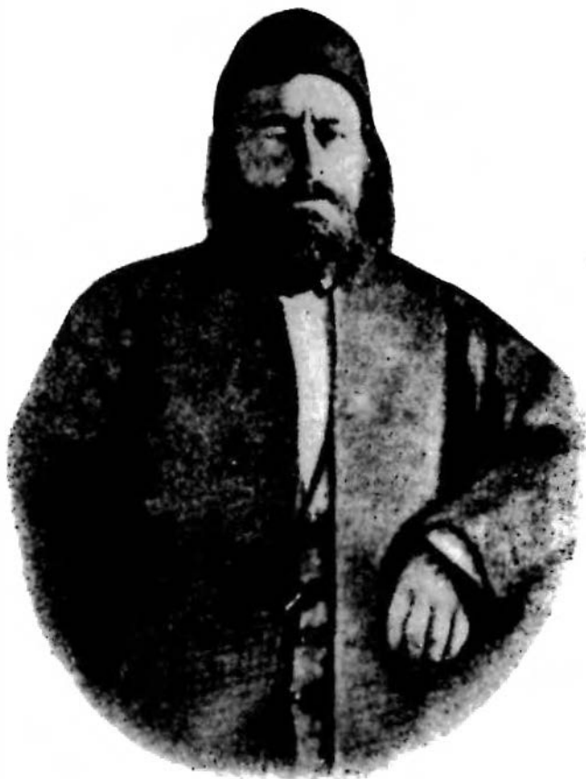
Res. 5 — Mısır Valisi Melnet Sait Paşa