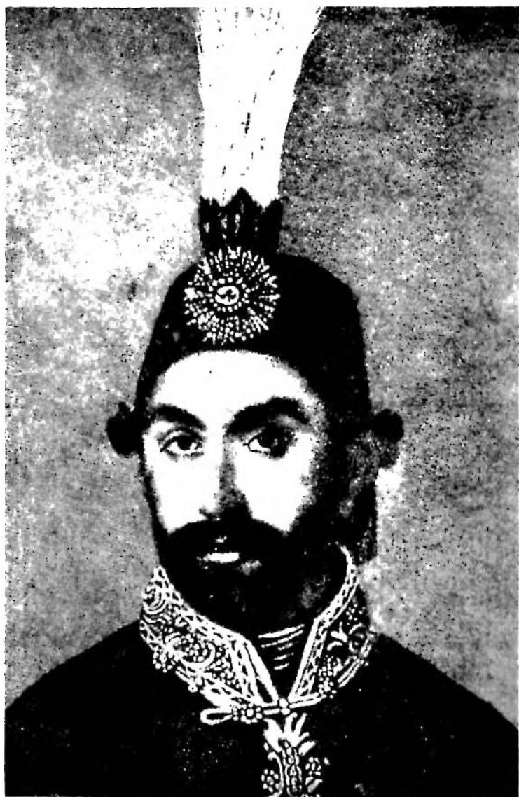
Res. 1 — Sultan Abdülmecid Han "1839—1861"