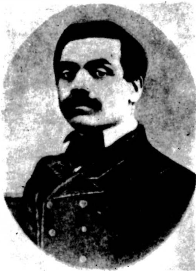
Res. 8 — Şinasi