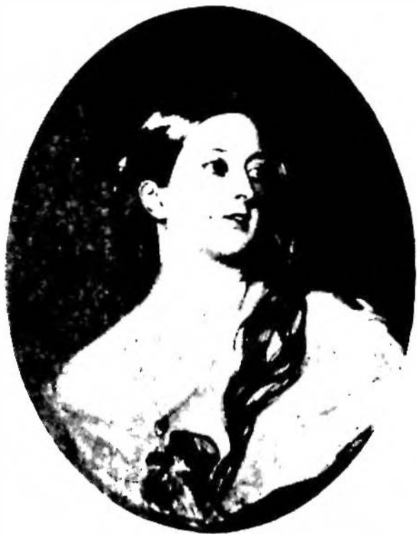
Res. 3 — İngiltere Kraliçesi Victoria