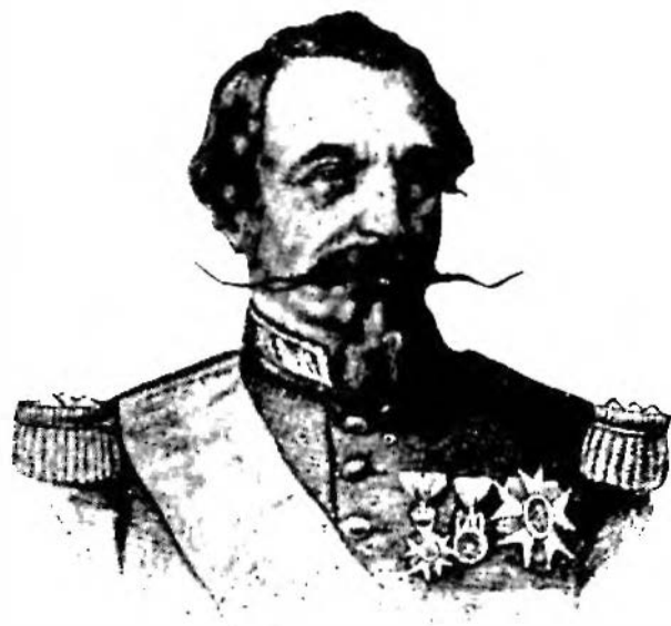
Res. 4 — Fransızlar İmparatoru III. Napoléon