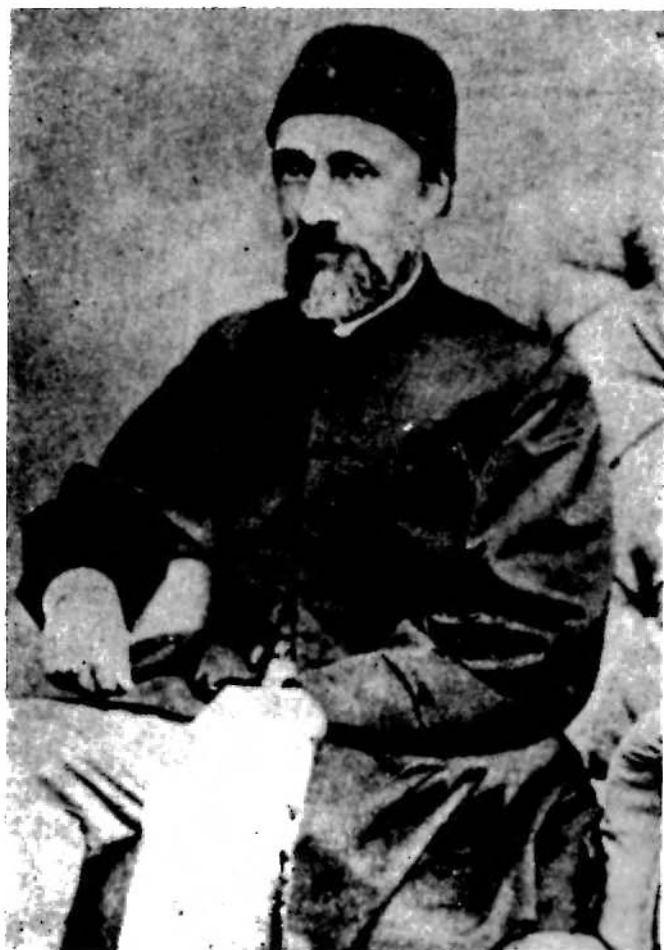
Res. 6 — Mehmet Emin Âli Paşa