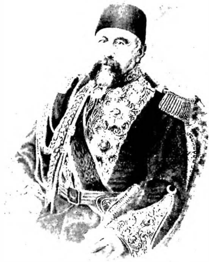
Res. 2 — Fust Paşa