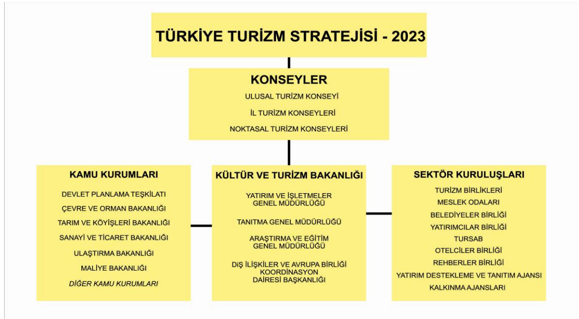
Grafik 1. Örgütlenme Şeması

Turizm strateji belgesinin uygulanması sürecinde faal olarak görev alacak kurum ve kuruluşların örgütlenme şeması aşağıda verilmektedir.